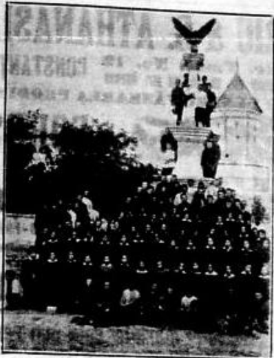
MONUMENTUL DIN ADAMCLISI SI ELEVII GIMNAZIULUI